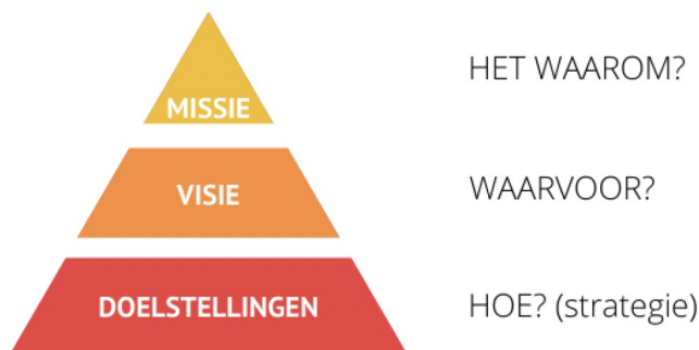
Figuur 2. Missie- en visie piramide